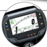
Z 500 SE ABS

Quilla / Sliders / Cobertor de radiador Cubre asiento trasero / Usb tipo C / Tablero TFT